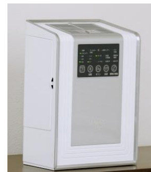
O 3 MAX Air